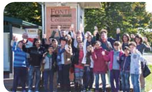
I bambini inaugurano la Casa dell'Acqua