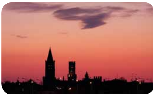
In arrivo l'illuminazione a Led a Busseto

“Il futuro è pianificazione: sostenibilità delle scelte, valorizzazione ambientale e qualificazione degli interventi”